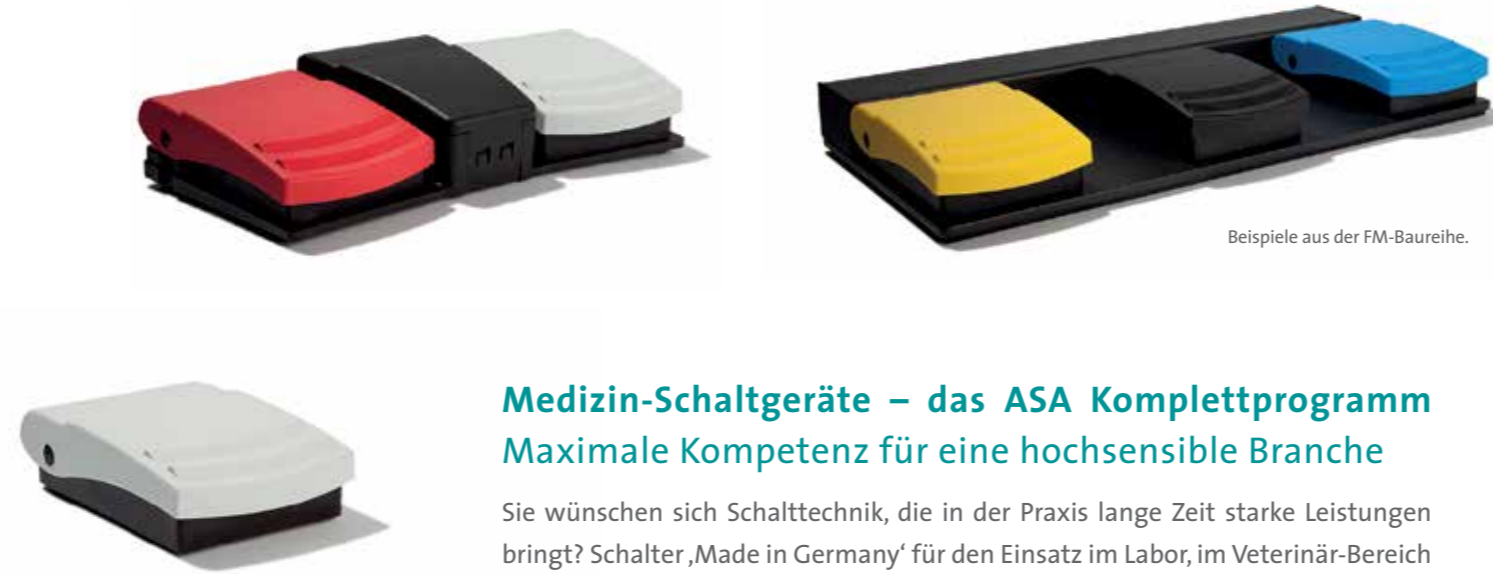
Beispiele aus der FM-Baureihe.