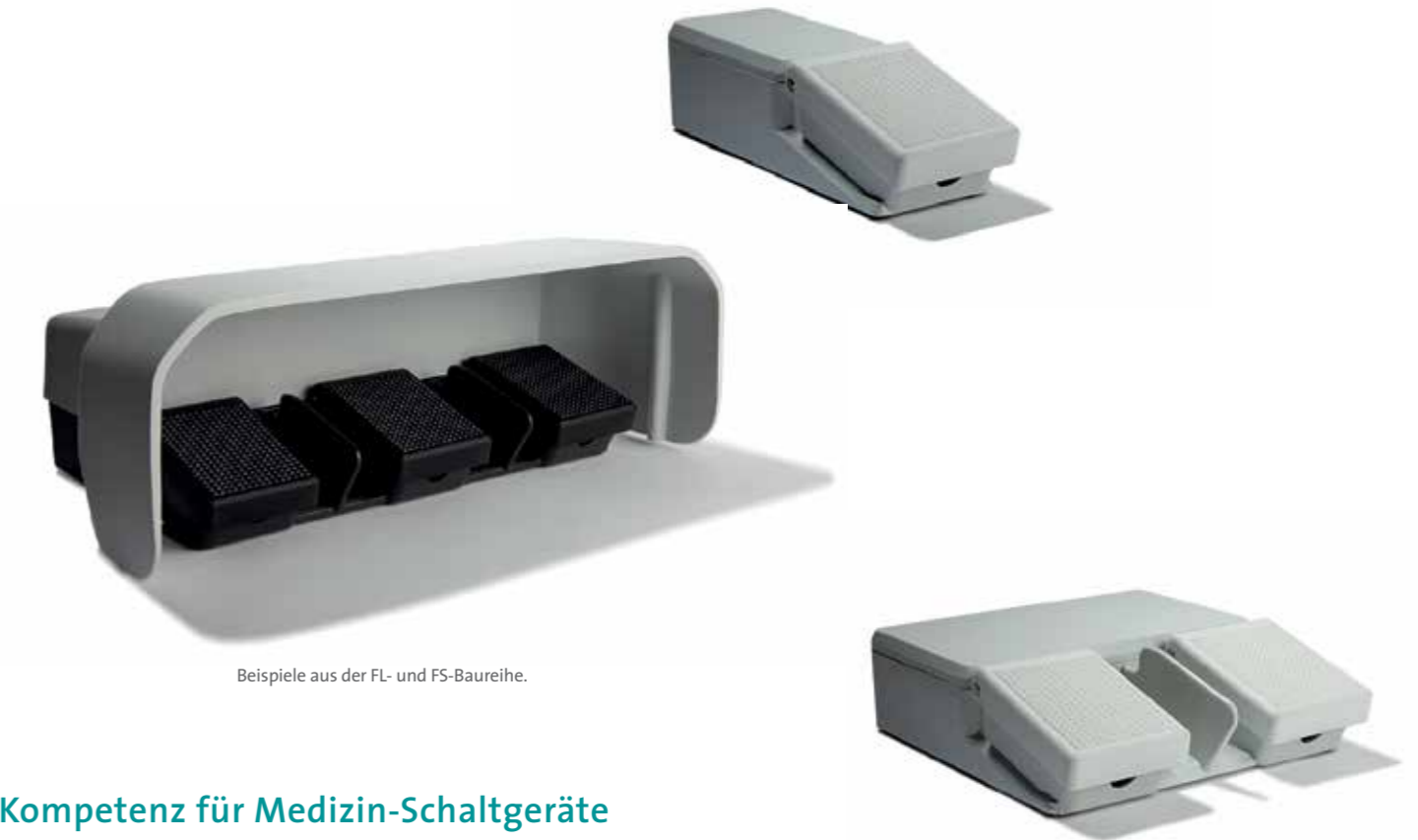
Beispiele aus der FL- und FS-Baureihe.