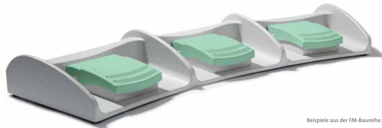
Beispiele aus der FM-Baureihe.